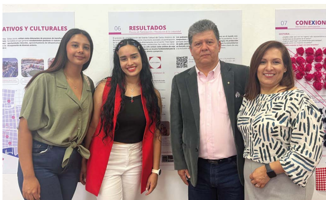
Mediante una exposición interactiva, los investigadores informaron a la comunidad y propiciaron su participación en el proyecto.