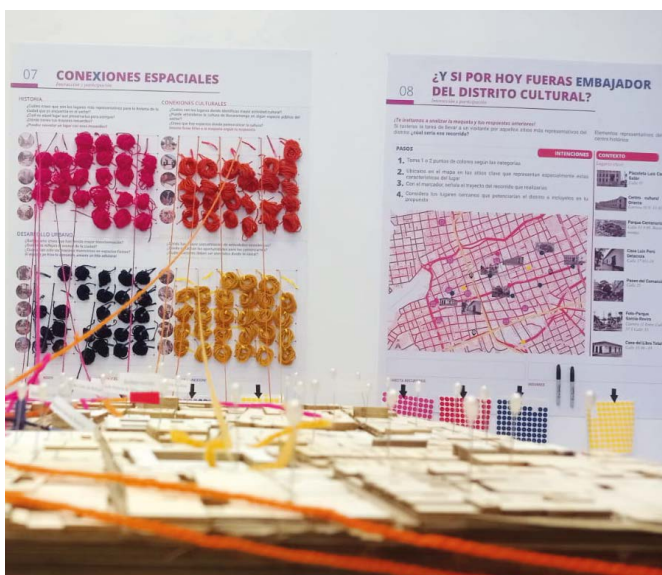
En diciembre del 2024, la exposición "Percepciones ciudadanas en pro de un distrito creativo y cultural" estuvo abierta al público tres días.

El concepto de ciudad caminable hace alusión a revalorizar el espacio público, transformándolo en lugar para el encuentro, la recreación y la vida social.