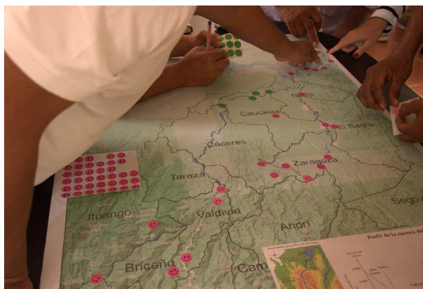
Mapeo del territorio fluvial y de lugares asociados al río Cauca, para dialogar sobre las problemáticas ambientales del afluente.

“Caudalosas corrientes se reúnen aquí y engendran tanta existencia como una madre. Los ríos son vasos sanguíneos de la Tierra, se distribuyen como una red, significan vida”, dice Mo Yan, Premio Nobel de Literatura 2012.