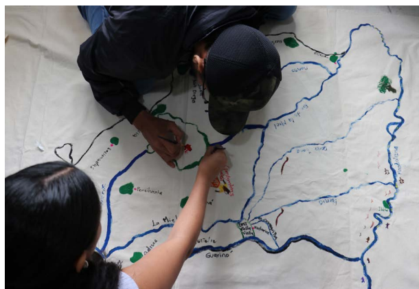
En los encuentros territoriales se mapearon los recursos ambientales, culturales, sociales de cada zona. Taller en Samaná, Caldas.