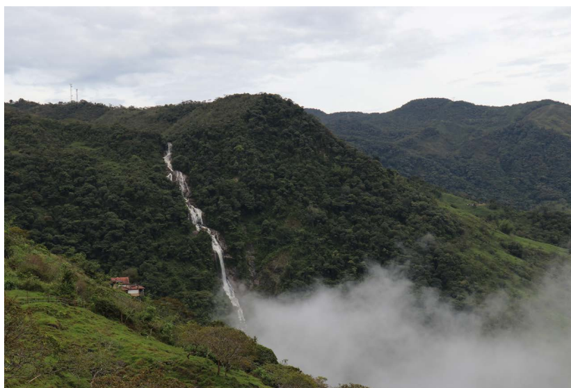
Río Dormilón a su paso hacia San Luis, Antioquia.