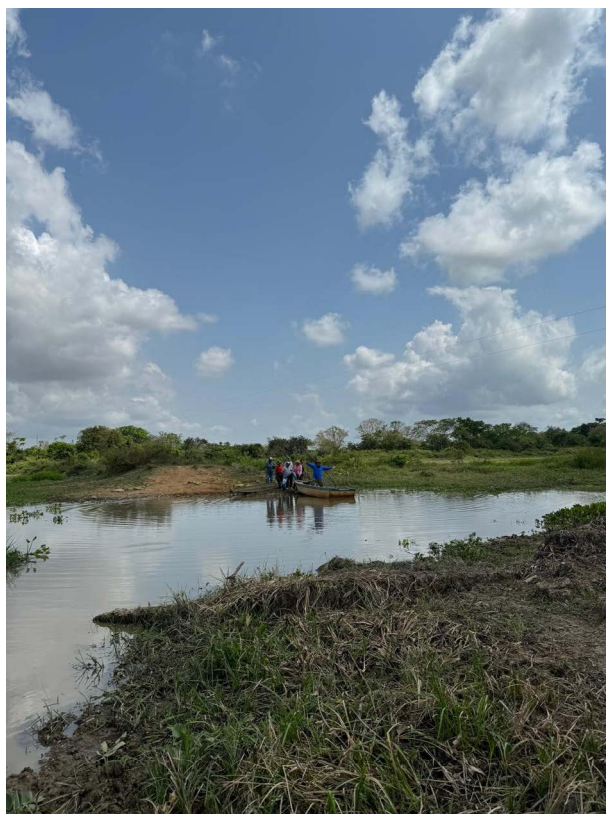
Recorrido al territorio fluvial complejo cenagoso Rio Cauca, Corregimiento Palomar. Espacio de conversación propositiva y activa, para conocer las relaciones hidrosociales y describir la situación actual de los procesos de construcción de paz alrededor de la defensa del río Cauca, Antioquia.

Todo partió con el abordaje y las implicaciones de la ecología política del agua, un planteamiento que se ha abierto campo en el análisis social y público de los problemas ambientales, en las relaciones de poder suscritas por la interacción humana con el entorno. El trabajo se inició en el río Dormilón, en el municipio de San Luis, Oriente antioqueño, y continuó con los otros tres afluentes en sus delimitaciones geográficas. Allí comenzaron a vincularse iniciativas, algunas que trabajan el tema ambiental del agua con distintos enfoques, en el diseño de un proyecto abierto a las comunidades locales desde la perspectiva de comprender el río como testigo de historias y relaciones complejas, con agencia propia. Un referente de este ejercicio lo hizo la Corte Constitucional, según su sentencia T-622 de 2016, reconociendo al río Atrato, su cuenca y afluentes "como entidad sujeto de derechos a la protección, conservación, mantenimiento y restauración", una decisión judicial trascendente y extendida a la geografía del país.