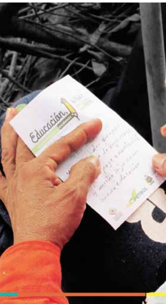
El desarrollo del modelo educativo para Barrancabermeja propuso edificar a partir de lo construido.