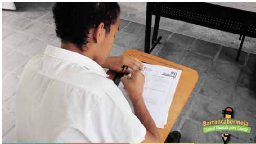
Los estudiantes también hicieron sus aportes para el modelo educativo de ciudad.