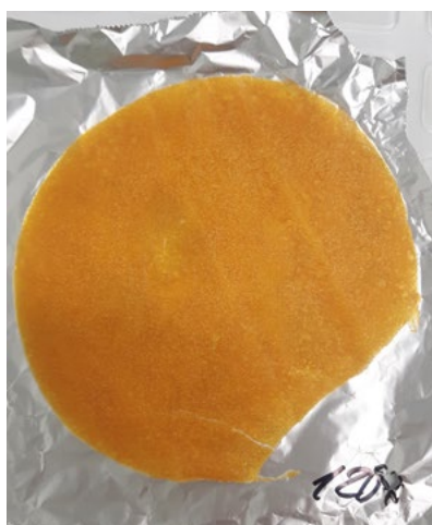
Láminas de pulpa de mango deshidratadas con la técnica secado por ventana refractiva, en diferentes tiempos.

Se compararon dos técnicas de deshidratación de frutos para verificar la permanencia de la mayoría de sus propiedades y nutrientes.