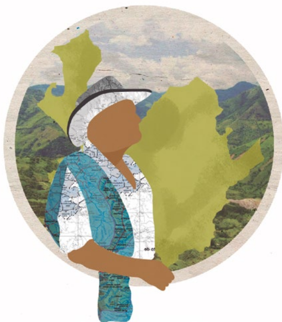
Ilustración: Daniela Umaña Vélez

La Universidad contribuye con una solución real a un problema específico en la alimentación infantil, además de significar una fuente exportadora de valor agregado.