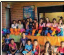
“Escuela Viva” Centro Educativo La Aldea