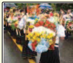
“Escuela y Flores” C. E. El Placer