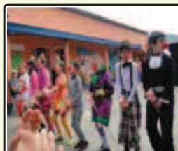
“Escuela Ambiental Abierta” C. E. Fabio Zuluaga Orozco