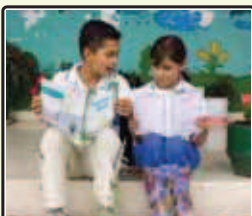
“La Escuela de la Felicidad” C. E. Yarumalito