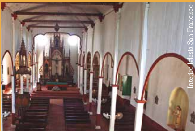
Interior Iglesia San Francisco

Esta práctica de campo, auténtico ejercicio de los que se forjan como investigadores, requiere como requisito “obligatorio” el traje de la aventura. Para llegar a este encantador paraje de la geografía nacional, hay que hacer un recorrido –desde Montería- de cuatro horas por tierra y una hora por Ferry hasta llegar a un puerto conocido como Bodega, donde se toma un transporte hacia la emblemática ciudad de Mompox.