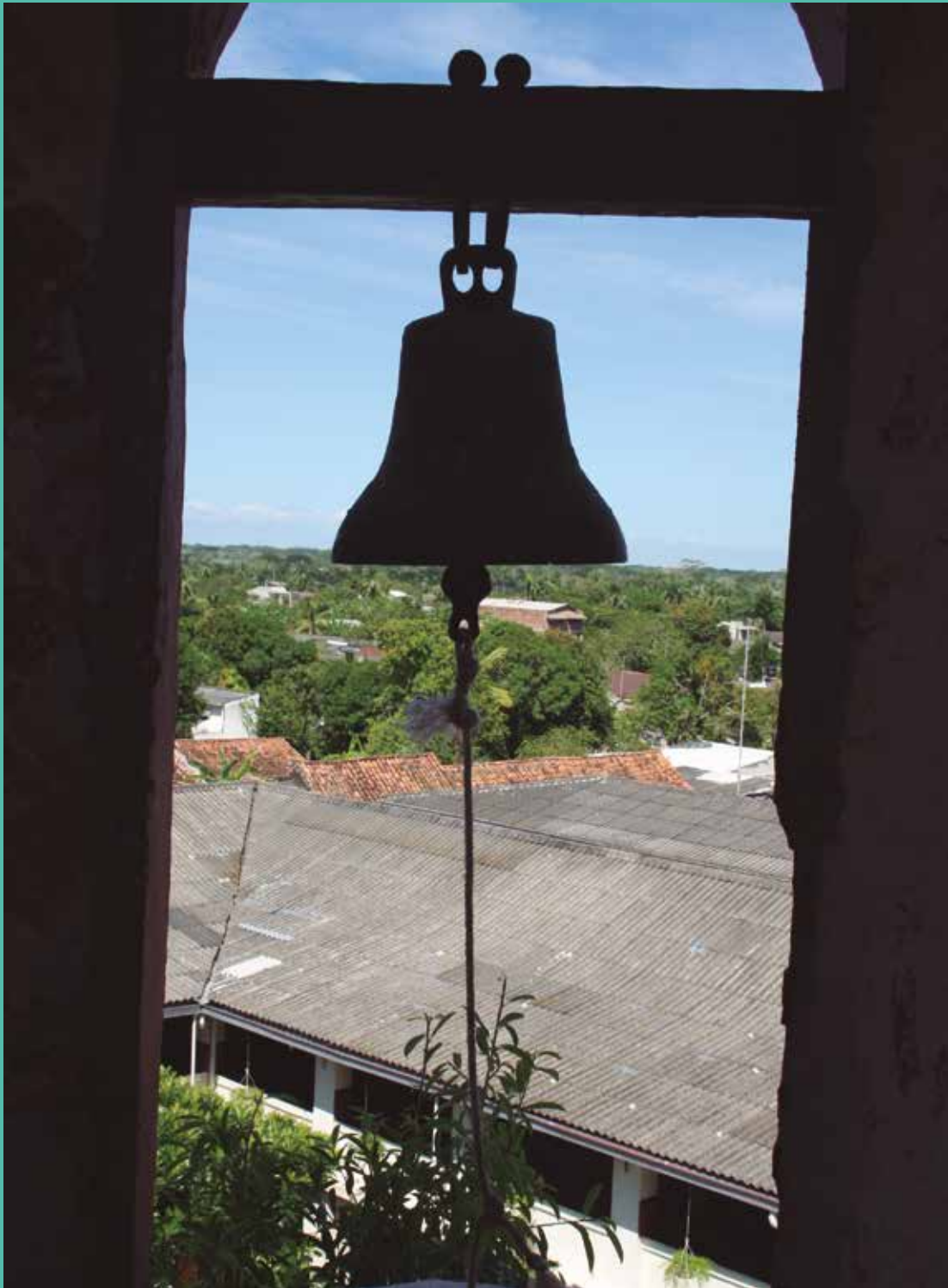
Campanario Iglesia San Francisco

Emulando el desembarco que hizo el conquistador Rodrigo de Bastidas en 1501 a orillas del río Magdalena, los jóvenes estudiantes del Semillero de Investigación, “armados” de tecnología del siglo XXI, le despojaron al tiempo sus manecillas de reloj para adentrarse en una aventura que los llevó por un viaje 400 años atrás, en la historia de este pueblo de Colombia declarado desde 1995 por la Unesco Patrimonio de la Humanidad.