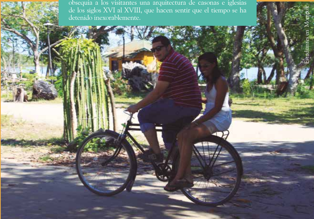
Estudiantes en Mompox

Galardonada con una rica amalgama de títulos como 'Monumento Nacional', 'Patrimonio Histórico y Cultural de la Humanidad', 'Ciudad Valerosa' y 'Ciudad Museo' entre otros, a su llegada les obsequia a los visitantes una arquitectura de casonas e iglesias de los siglos XVI al XVIII, que hacen sentir que el tiempo se ha detenido inexorablemente.