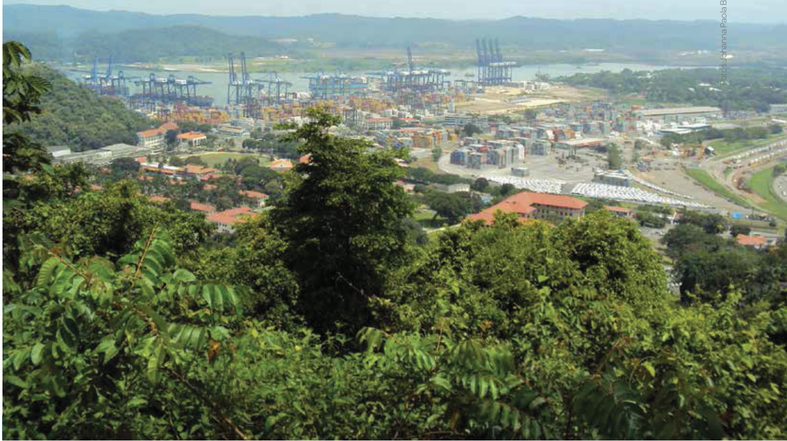
Vista del Canal de Panamá