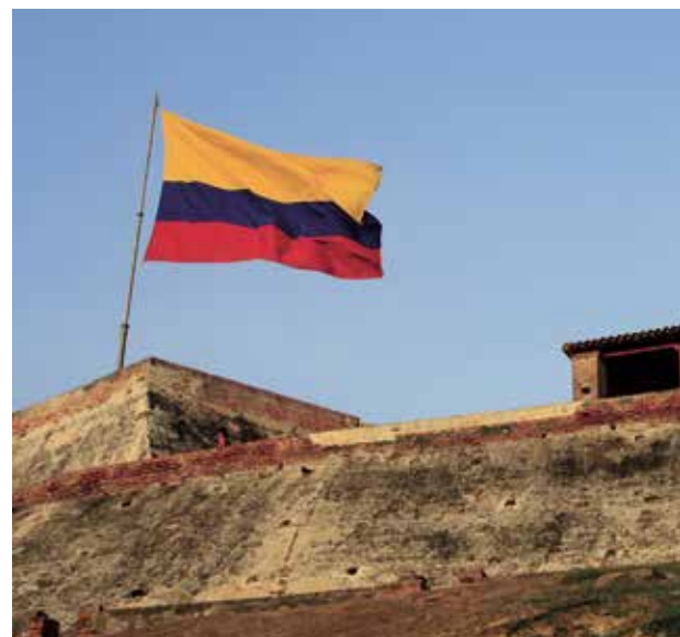
Calles, corredores y construcciones dan cuenta del legado histórico de la ciudad.