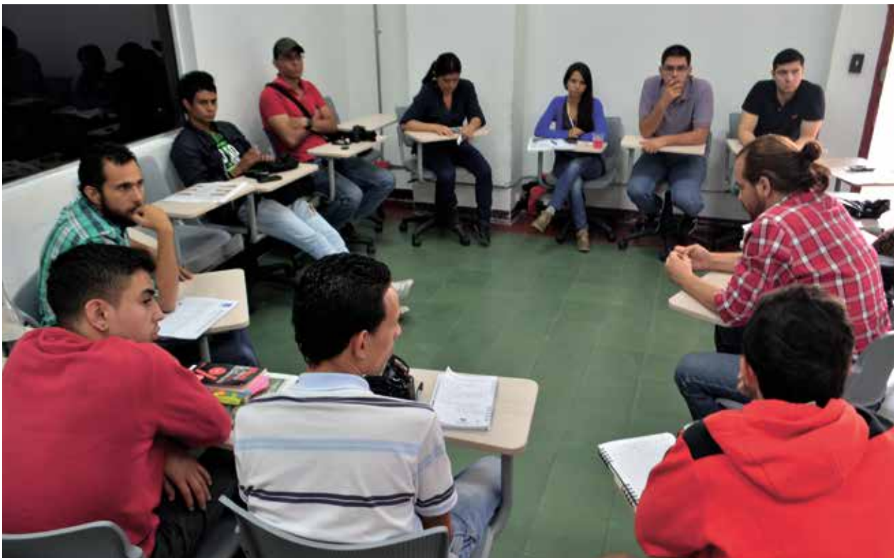
Los grupos focales hacen parte de esta metodología de trabajo.

Son varios los proyectos que han estado en la mira de Voces Ciudadanas, como Vive el Centro, iniciativa que permitió plantear soluciones a las problemáticas que vivía esta zona de la ciudad y que dio pie a la creación de nuevas políticas y medidas para combatir la inseguridad. Voces Ciudadanas por la educación aportó elementos y concepciones al Plan decenal de educación y Voces Ciudadanas por la seguridad y la convivencia generó un espacio de diálogo en torno a la seguridad con el fin de crear una política pública en este tema que fortaleciera la presencia policial en zonas periféricas de la ciudad, entre otros.