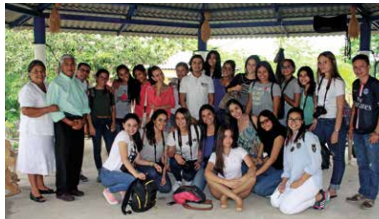
Docentes y estudiantes con los líderes de Morroa.

En Morroa los visitantes también son atraídos por productos artesanales como: mochilas, billeteras, cosmetiqueras, bolsos, cinturones, entre otros.