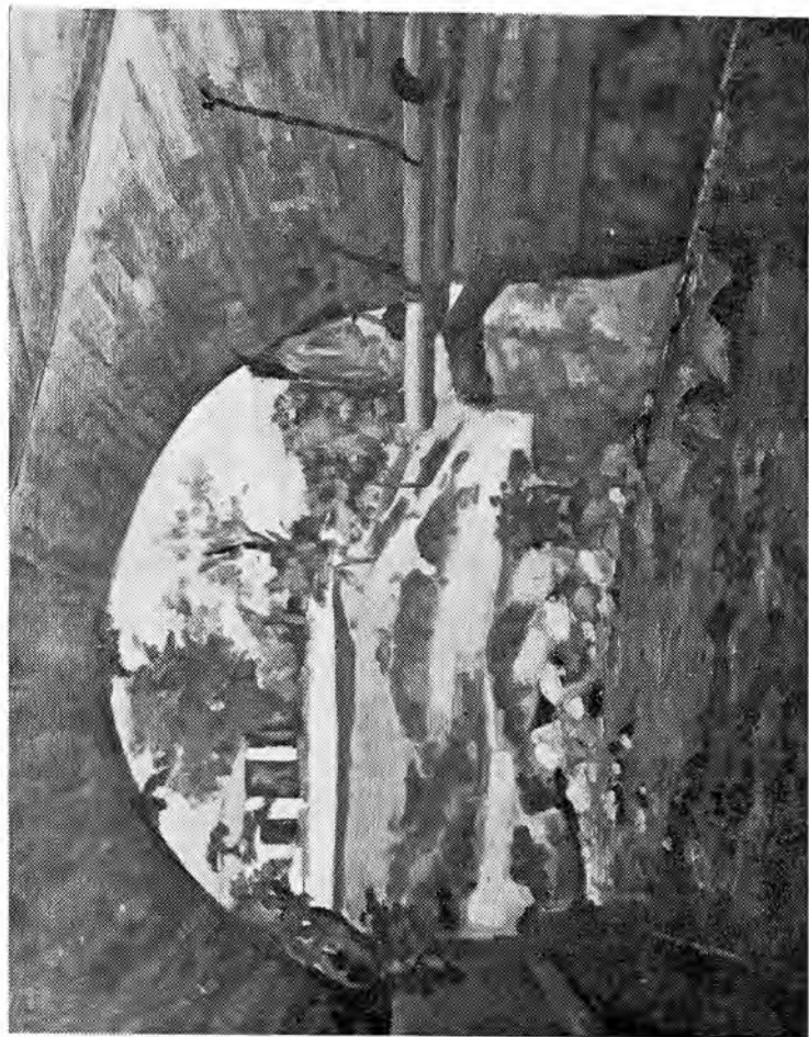
QUEBRADA Y PUENTE (Olco) (42 x 47 cm.)