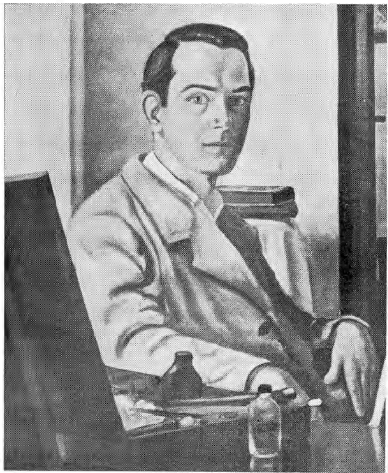
AUTO-RETRATO (Oleo) (61 x 71 cm.)