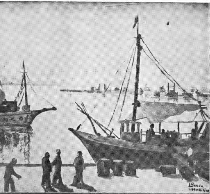
BAHIA DE CARTAGENA (Oleo) (44 x 49 cm.)