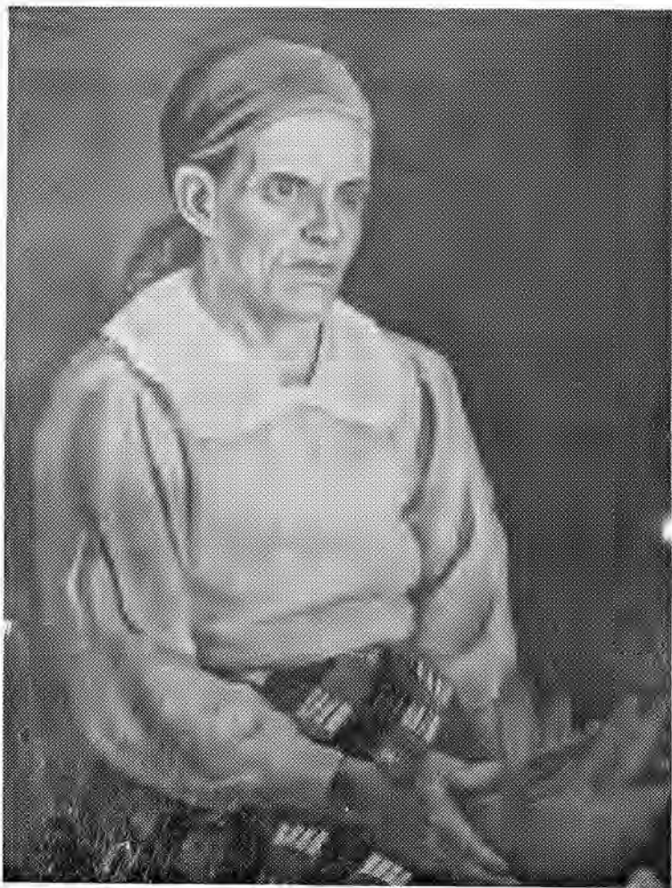
VIEJA VENDEDORA (Oleo) (79 x 63 cm.)