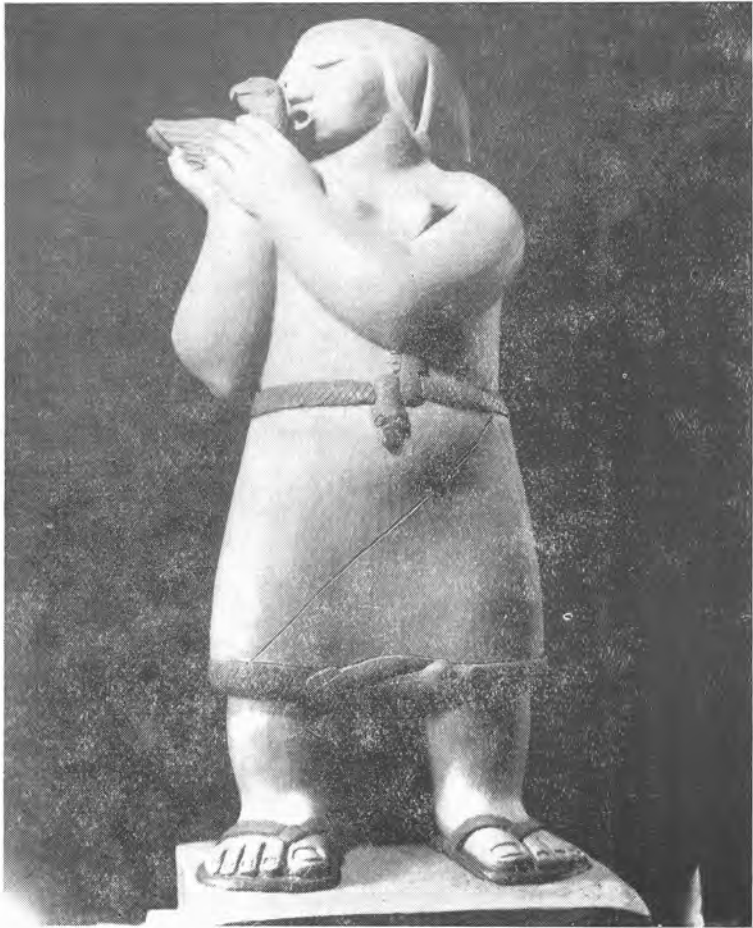
Mujer enseñando a hablar a su loro (Terra-cota)