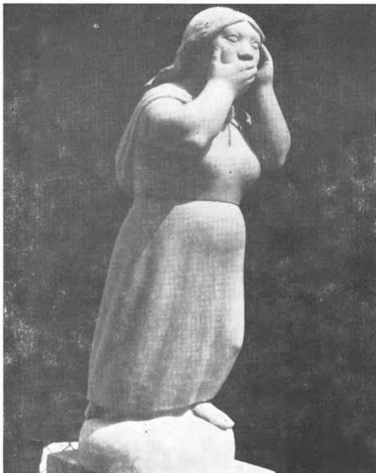
La Huida (Terra-cota)