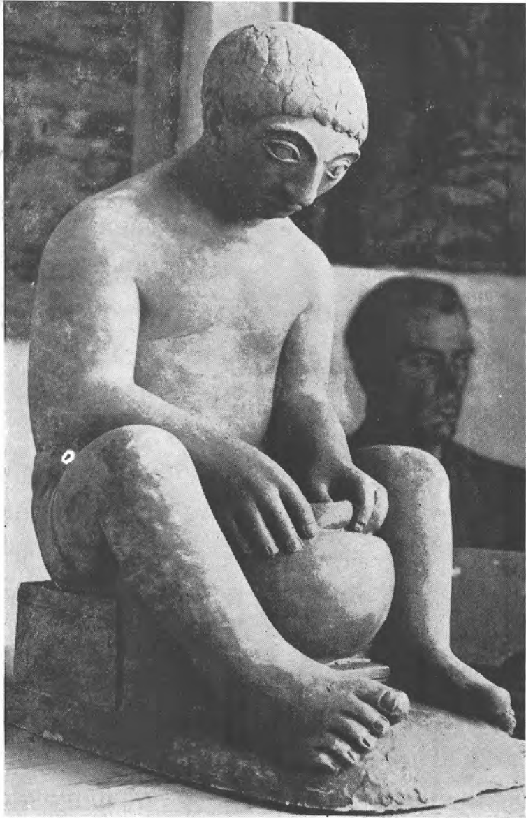
El Alfarero (Terra-cota)