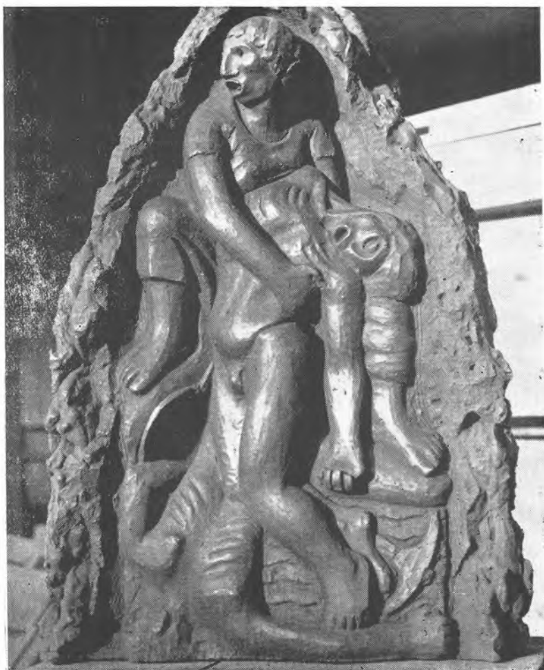
La muerte del minero (Relieve en yeso)