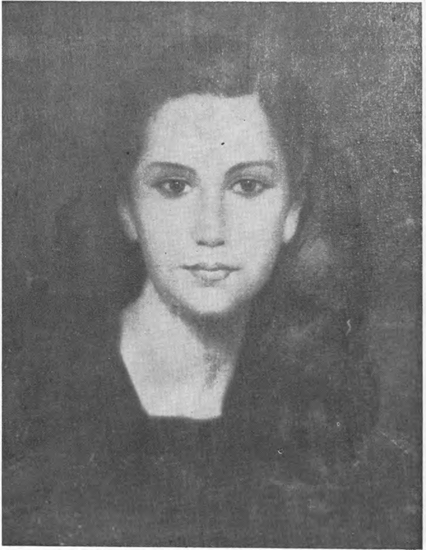
CABEZA EN NEGRO