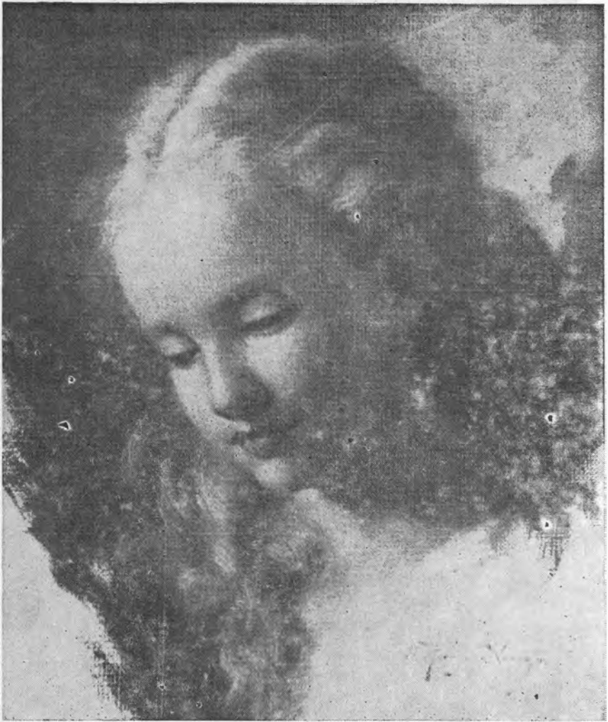
LA HIJA DEL PINTOR