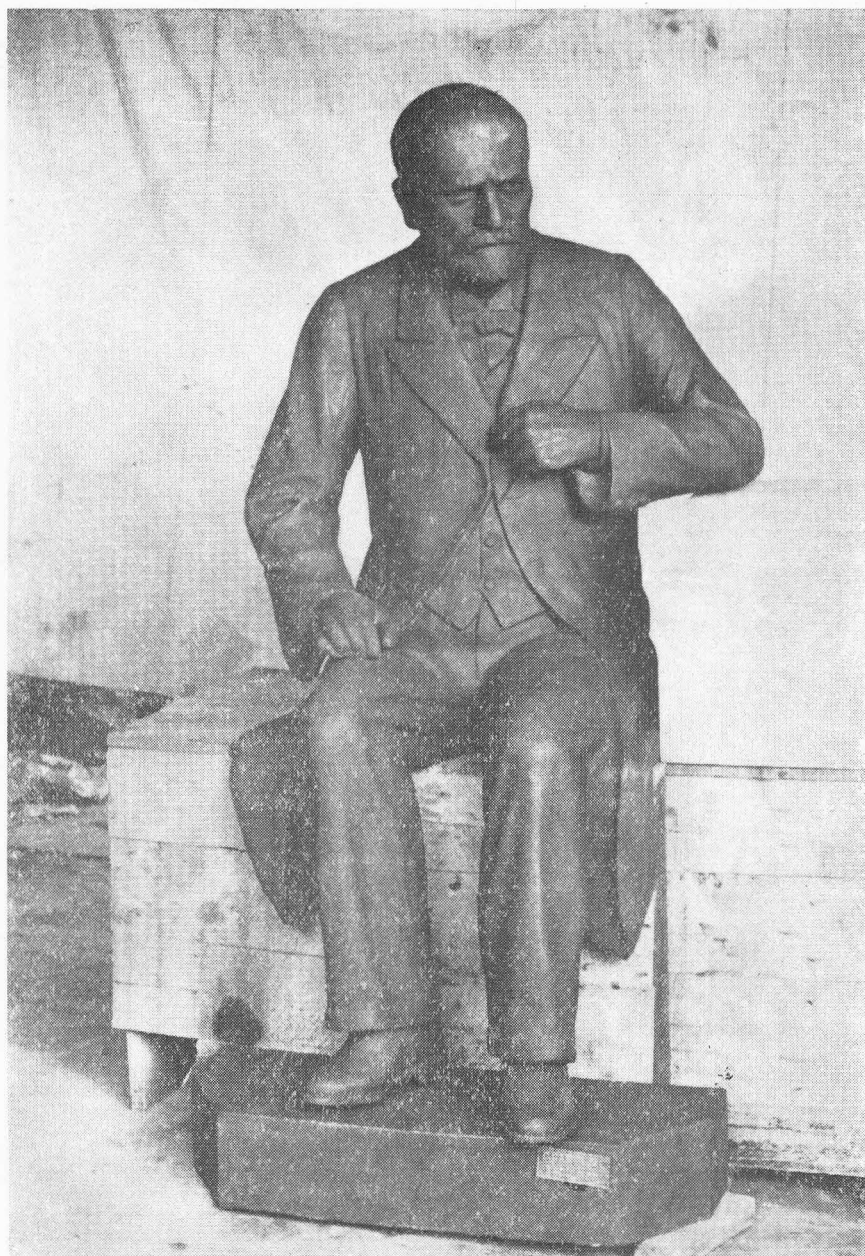
Estatua de Marco Fidel Suárez