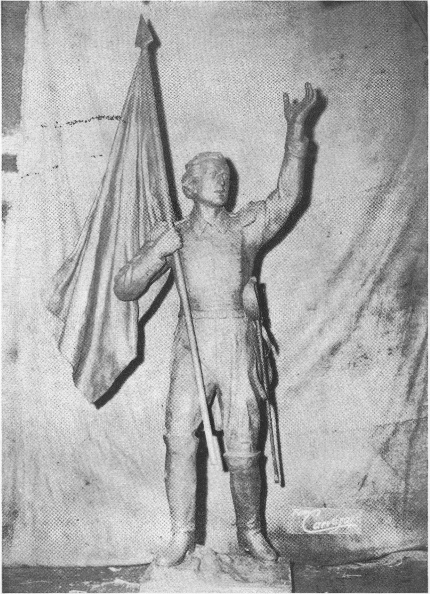
Estatua de Atanasio Girardot