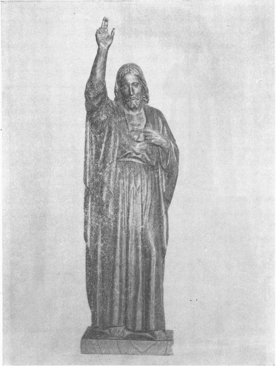
Estatua del Sagrado Corazón de Jesús