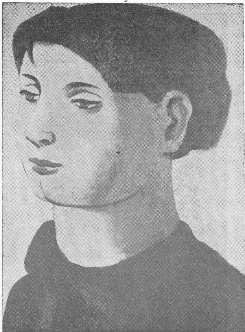
CABEZA DE UNA ADOLESCENTE - Oleo