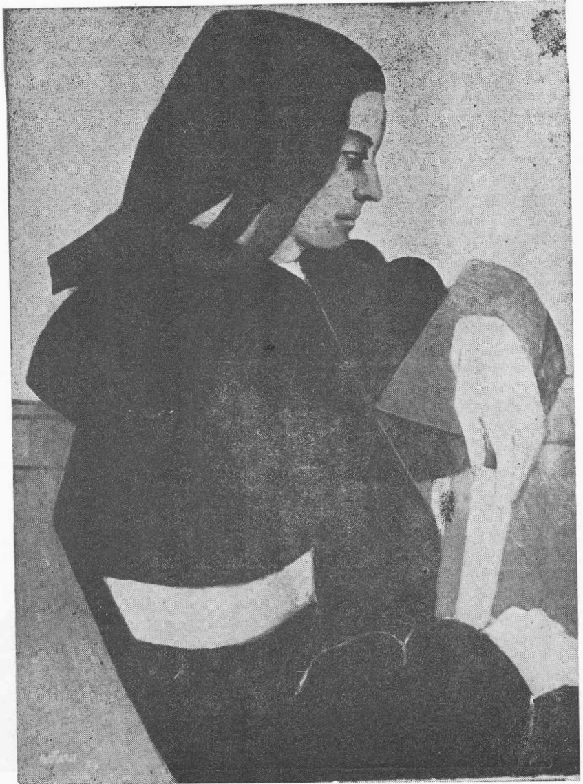
EL ABRIGO NEGRO - Oleo