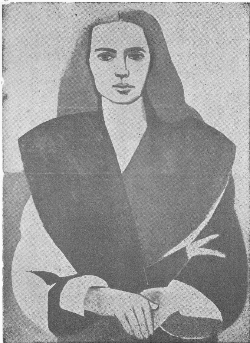
RETRATO CON EL ABRIGO AZUL - Oleo