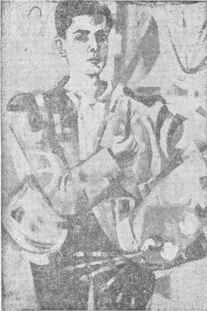
EL PINTOR - Piroxilina