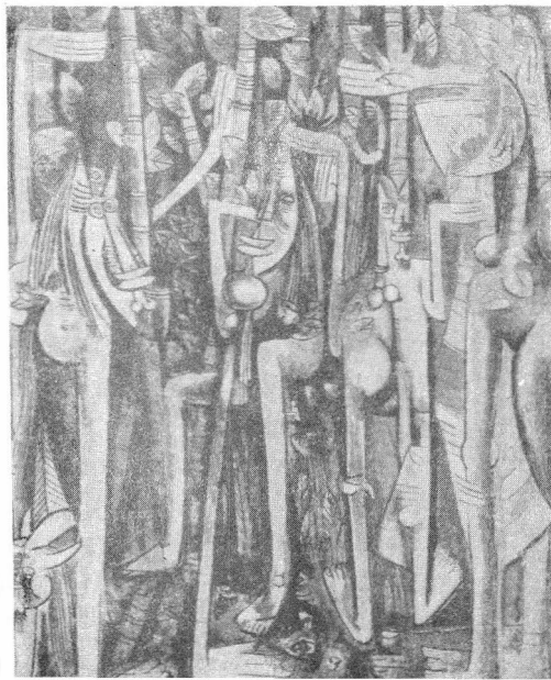
Wilfredo Lam "La Jungla"

aprendizaje tradicional, se presenta como alternativa el aprendizaje innovador, en calidad de instrumento adecuado para aproximar el futuro; es adaptable a casos imprevistos y a problemas enteramente nuevos; dado su carácter global integral y sistémico, permite evaluar múltiples alternativas de solución bajo ópticas diferentes y así crear nuevas opciones para sortear cada nuevo problema en forma óptima. Este aprendizaje innovador no sólo debe practicarse a nivel individual, sino que debe propiciarse su instrumentación a nivel colectivo y social, para así fomentar y permitir el cambio en forma