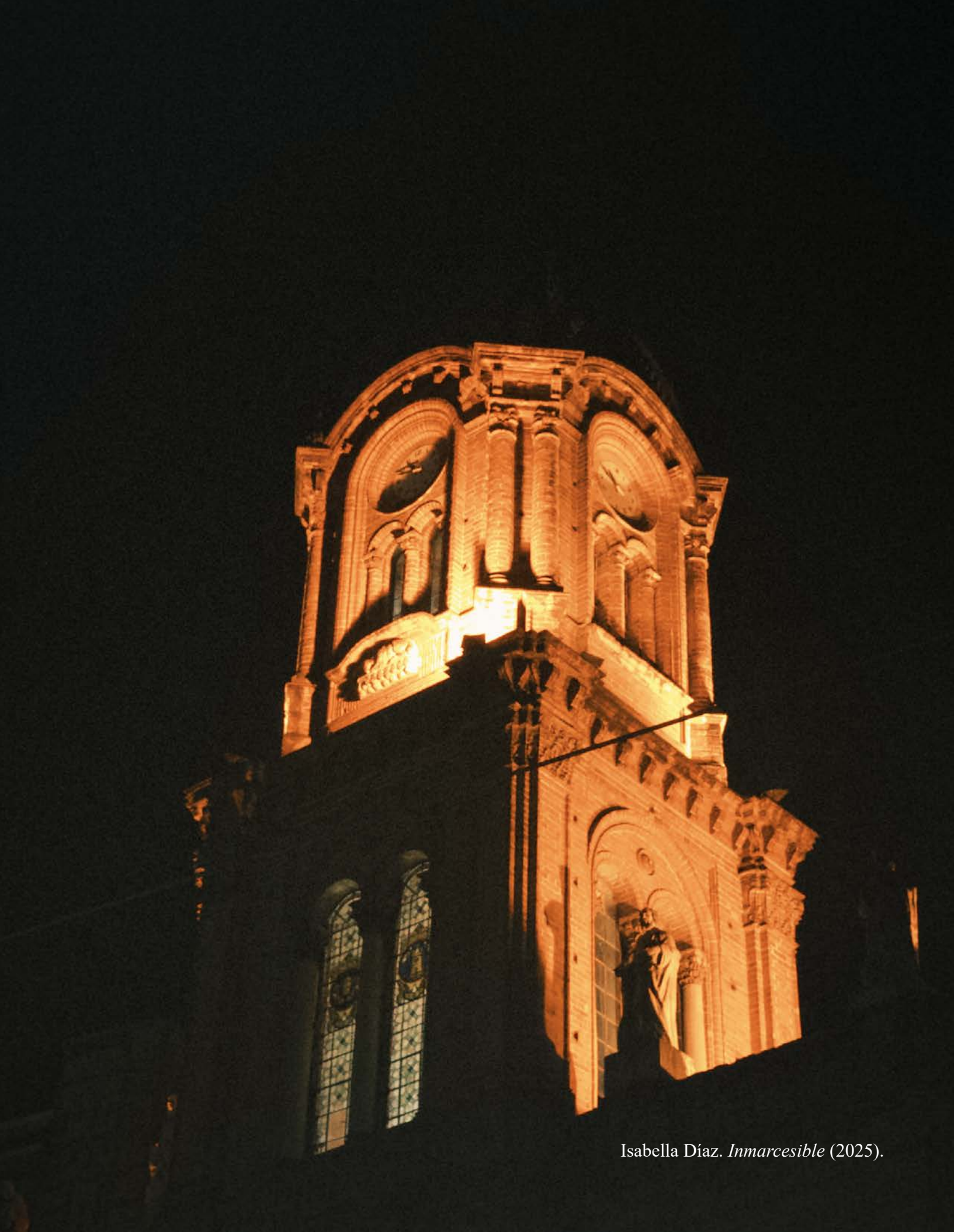
Isabella Díaz. Inmarcesible (2025).