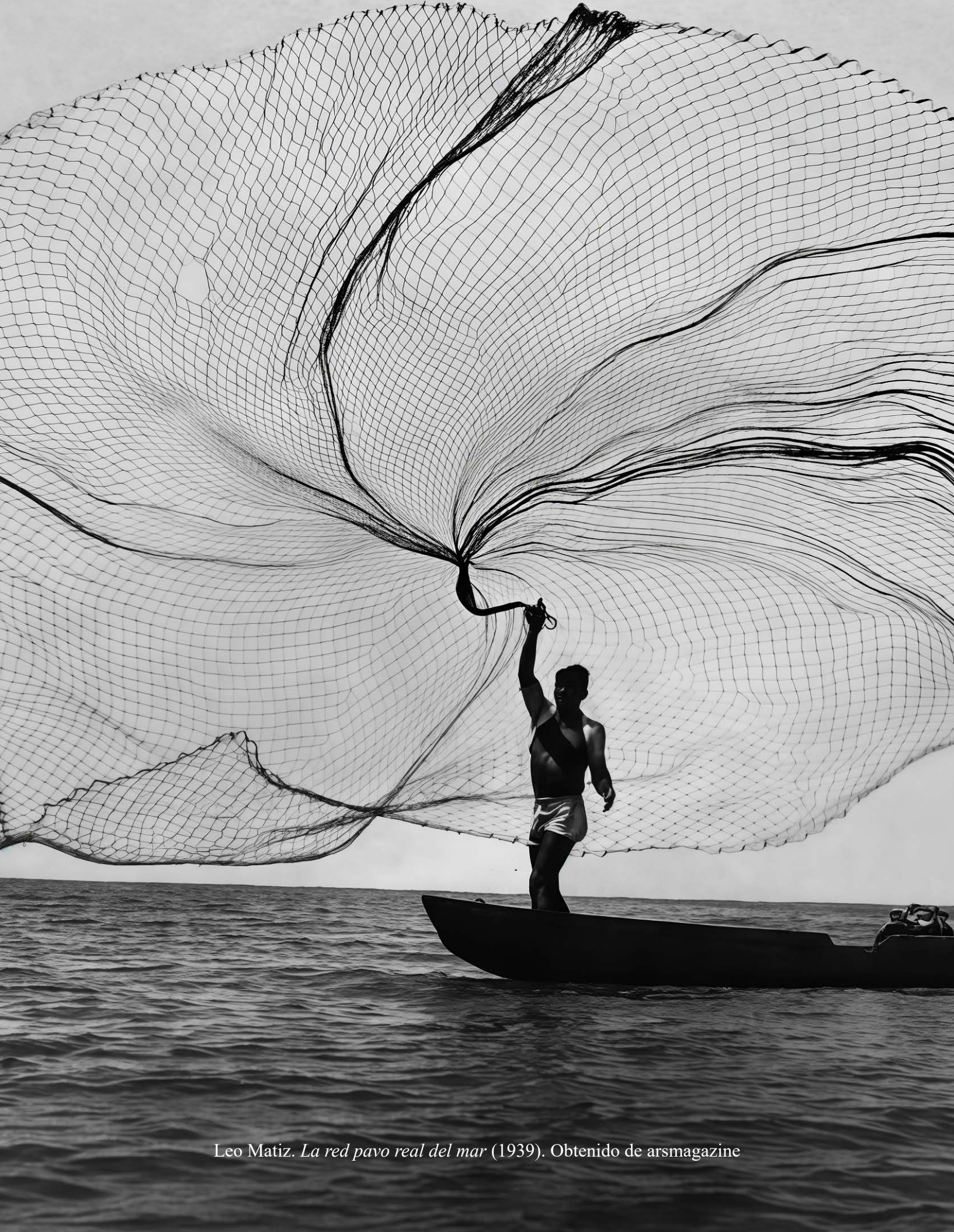
Leo Matiz. La red pavo real del mar (1939). Obtenido de arsmagazine