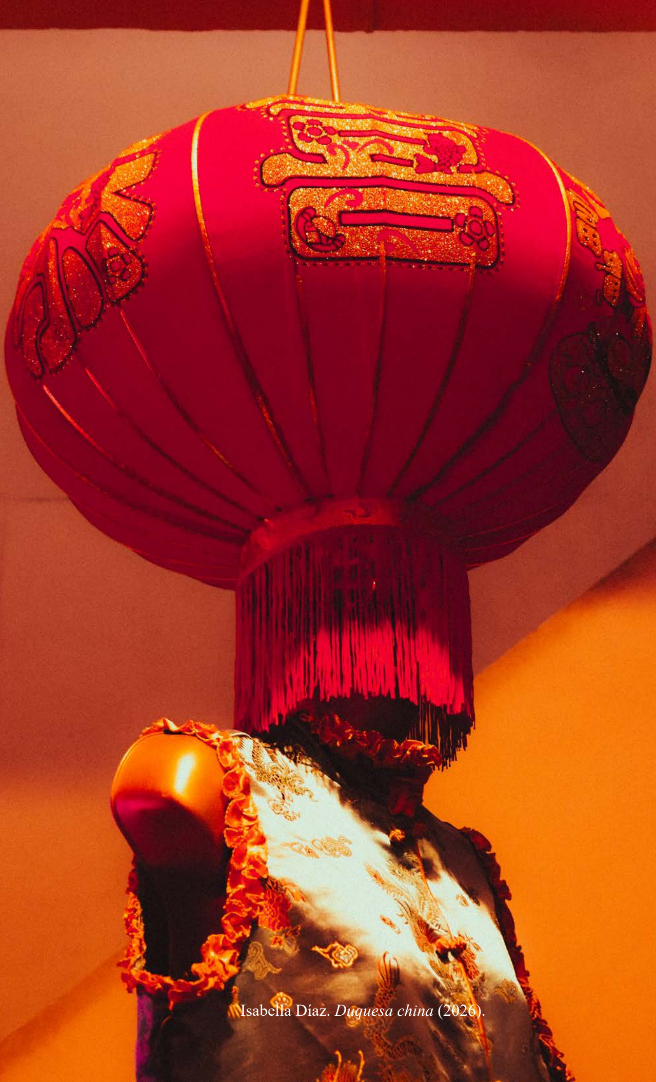
Isabella Díaz. Duquesa china (2026).