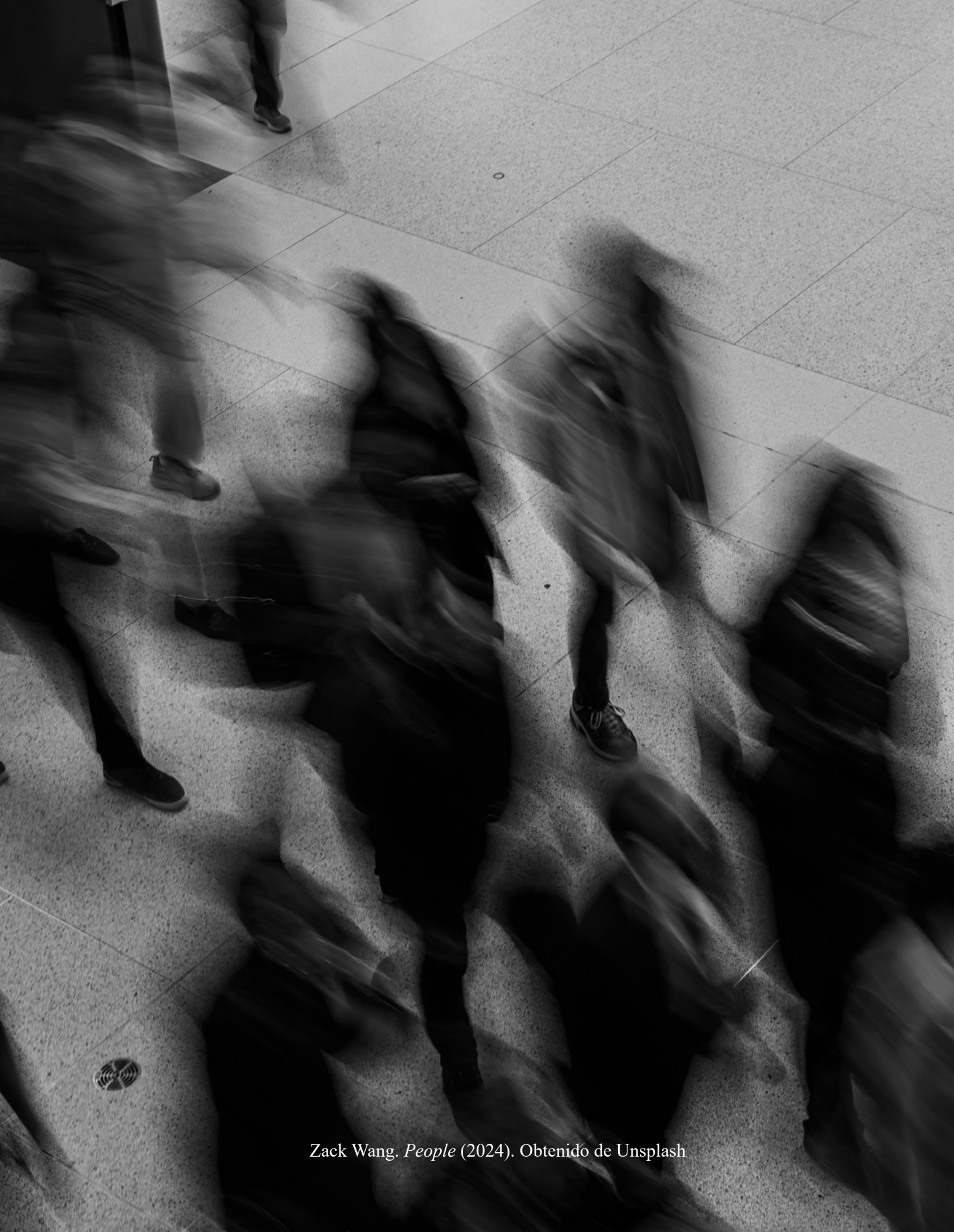
Zack Wang. People (2024). Obtenido de Unsplash