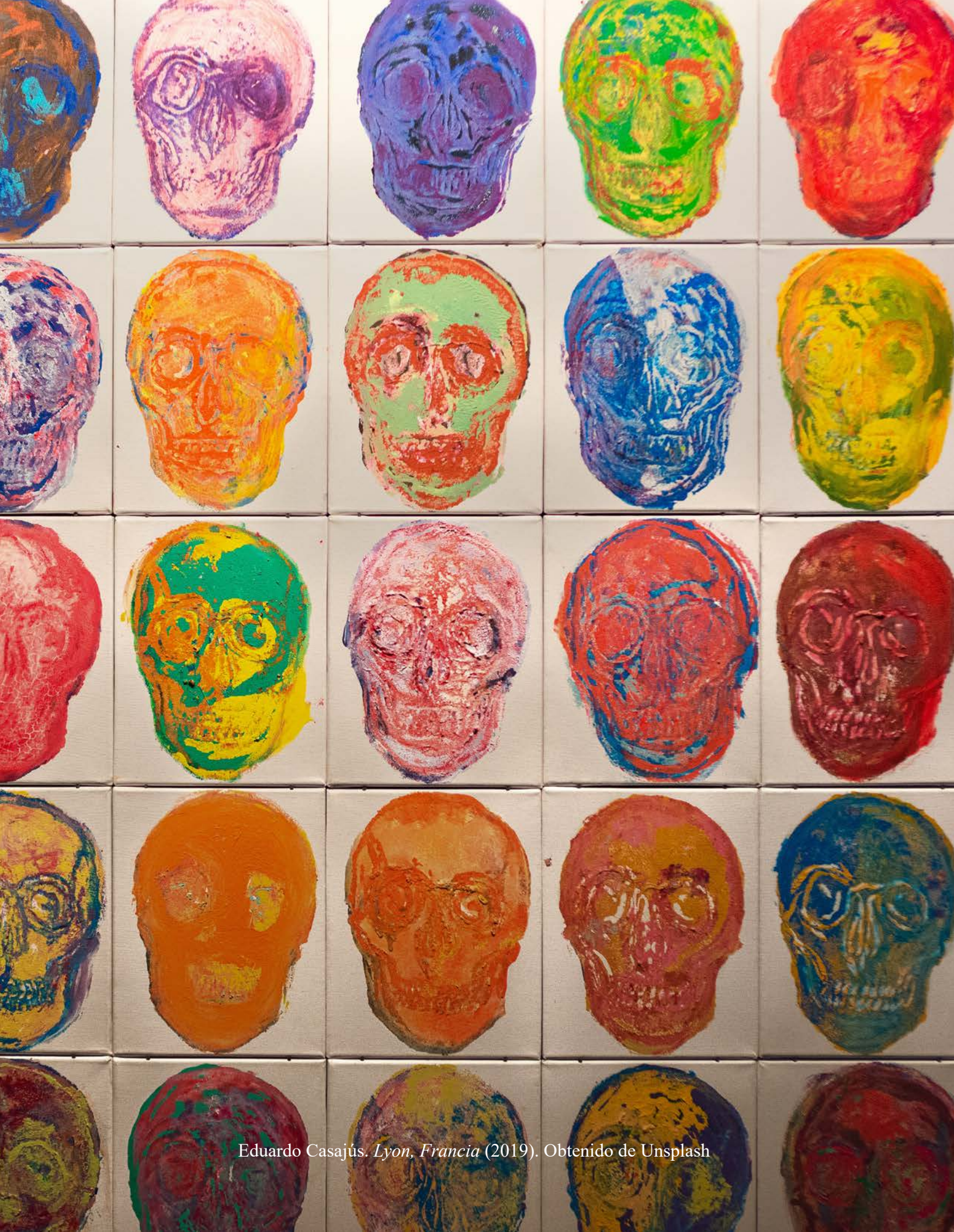
Eduardo Casajús. Lyon, Francia (2019). Obtenido de Unsplash