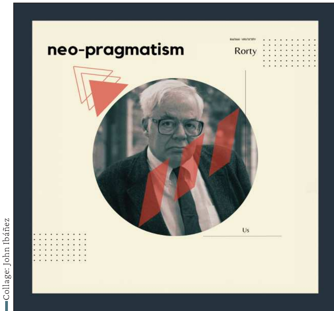
Collage: John Ibáñez

“El problema no es la correspondencia o los criterios veritativos, sino los criterios de aceptabilidad dentro de tal “juego de lenguaje”. Podemos decir, entonces que toda palabra y demás oraciones son parte de la gran familia del lenguaje, y su significatividad depende de la “función” que desempeñan dentro de un universo lingüístico, de su modo de empleo dentro de un juego determinado.” 2