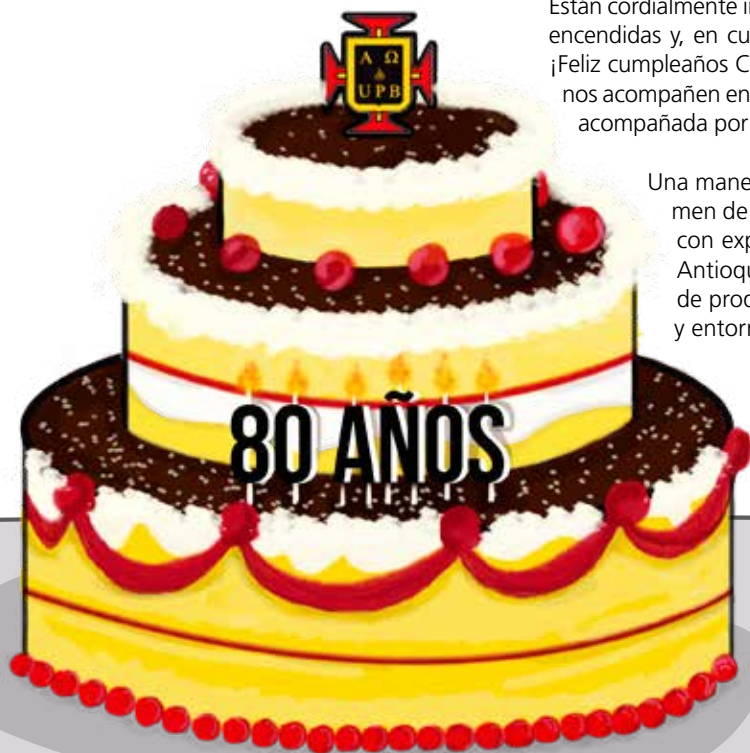
Ilustración: Estefanía Hernández Sandoval

Una manera de festejar juntos es con la lectura de este volumen de la Revista Ingenio, que nos permitirá encontrarnos con experiencias significativas de profes y estudiantes en Antioquia, que ven en la ciencia y en la tecnología formas de producir bienestar para sus comunidades y entornos más cercanos.