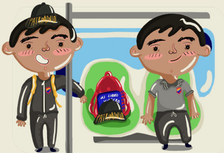
Ilustración: Vanessa Franco Clavijo

La participación en diferentes ferias de la ciencia locales, nacionales e internacionales, para compartir su experiencia, los motivó a seguir con su proyecto e invitar a los demás niños a investigar.