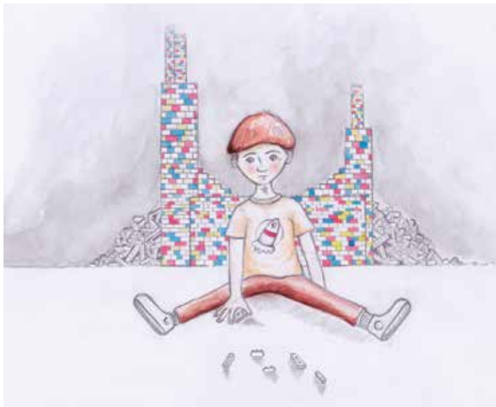
Ilustración: Alejandro Atehortua Vásquez

Esta experiencia fue muy agradable para nosotros, aprendimos un nuevo concepto de enseñanza y también nos expresamos de una manera particular, a través de fichas de lego.