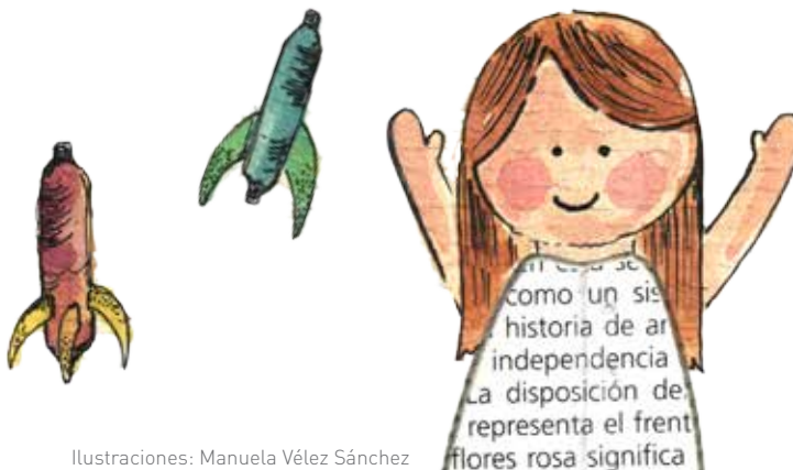
Ilustraciones: Manuela Vélez Sánchez

La Biblioteca Público-Barrial La Floresta hace parte del Sistema de Bibliotecas Públicas de Medellín, un proyecto de la Secretaría de Cultura Ciudadana, que tiene 27 bibliotecas más en la ciudad para que las visitemos.