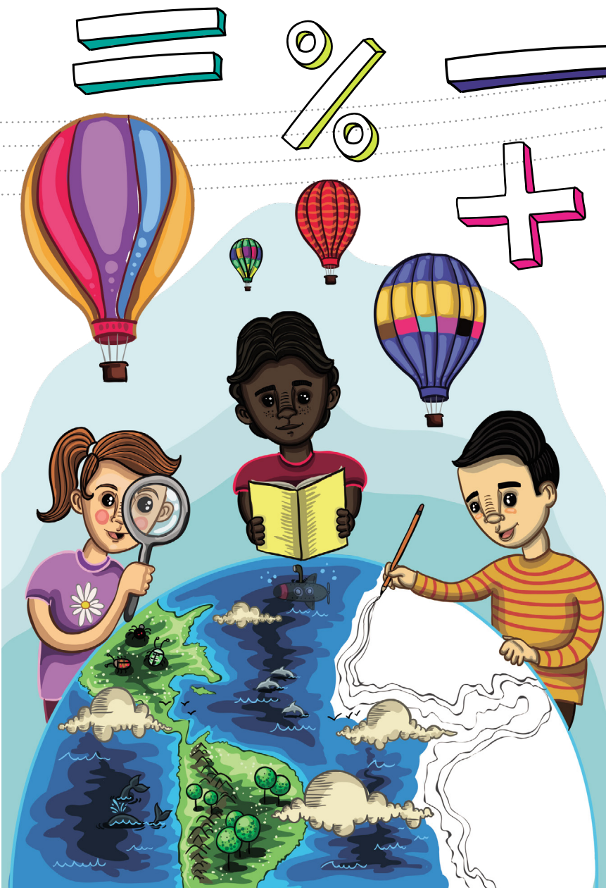
Ilustración: Santiago García Gutiérrez

Para lograr el objetivo, que es maximizar el acompañamiento familiar y el aprendizaje matemático de los estudiantes, se utilizó como metodología hacer reuniones periódicas en jornada contraria con los padres y estudiantes. En estas reuniones se enseñan temas como suma, resta, multiplicación, perímetro y área con múltiples herramientas didácticas para facilitar el aprendizaje.