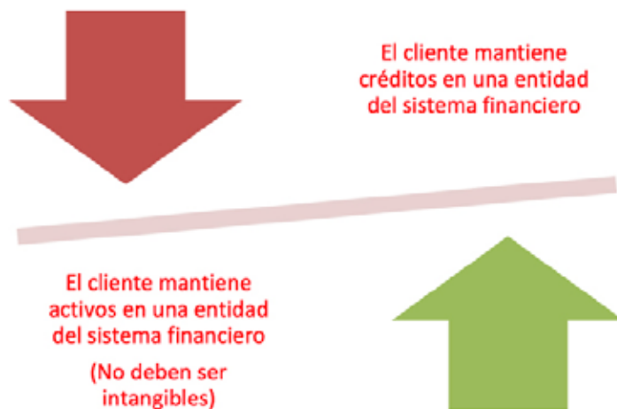
Figura 1. Presupuestos del Derecho de compensación

Nota: El gráfico no muestra una relación directa con lo que se desarrolla previamente.