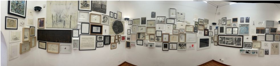
Nota. Imagen panorámica de la instalación.

aparece como condición de posibilidad de uno mismo, que va siendo, se va conformando, en el acto de conformar a un otro. El dibujo es ruptura, simulación, indagación, negación del vacío, anhelo de lo corpóreo; pero también es la calma, los silencios y la ausencia. Fuerza mística de ese deseo de mostrarnos, de producir un mundo, dibujarlo. El dibujo nos dice algo, nos traduce. Existe ahí cuando no puede callar, ni desentenderse, ni escaparse, en esa eternidad trunca, en el temor de irnos dejando solo su huella, su perenne substancia. El dibujo nos trasciende, pero nos acompaña. Ese es el sentido de esta instalación, una lectura sobre el dibujo y, a través de él, sobre nuestro mundo, que ronda todos los espacios de la muestra Del dibujo como huella .