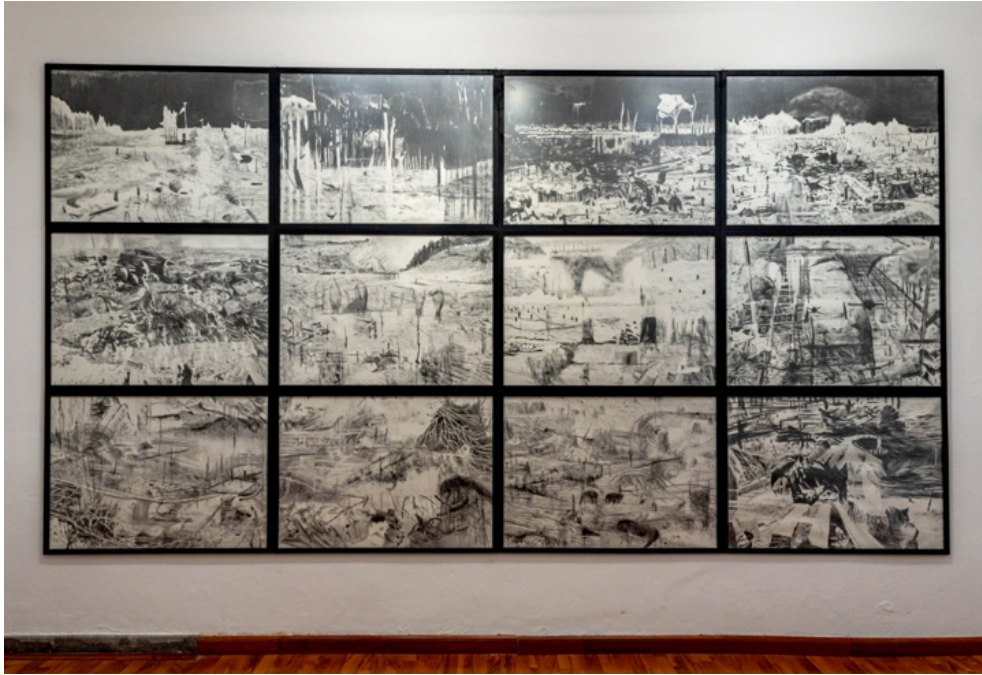
Nota. Registro de una parte de la instalación.