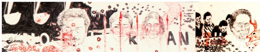
Nota. Fragmento de la obra de sitio específico.