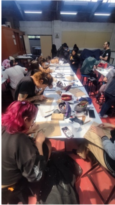
Nota. Registro del taller para la elaboración de las matrices xilográficas.