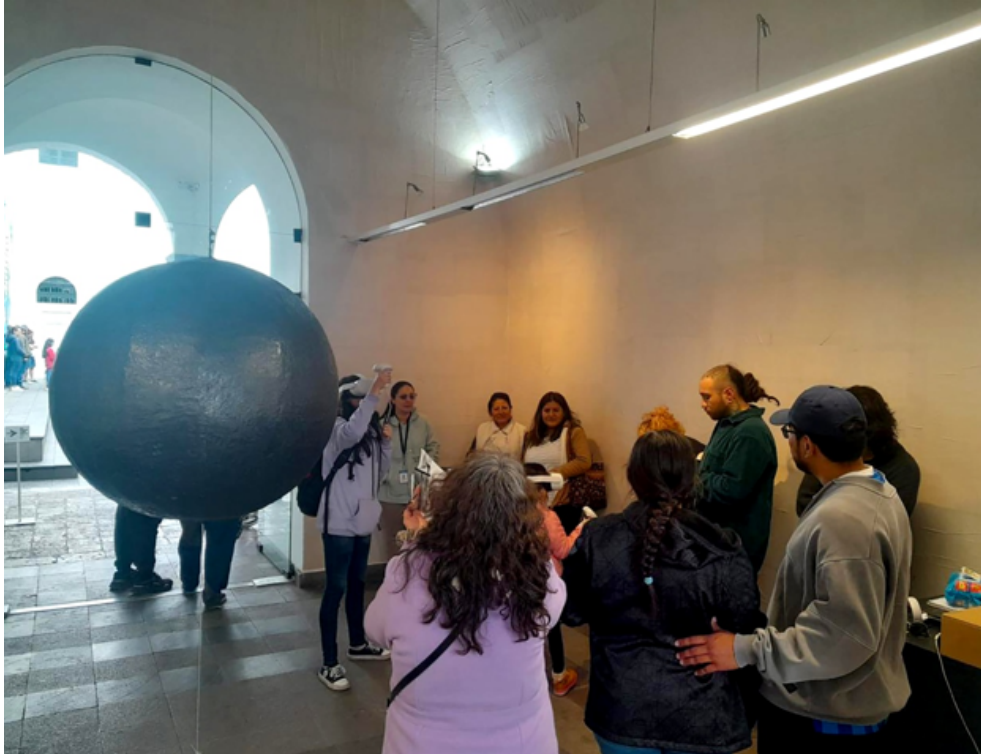
Nota. Instalación y registro del público interactuando con el espacio de realidad virtual de la obra.

Esta parte de la instalación tenía como objetivo la reflexión sobre el carácter colectivo e intersubjetivo del dibujo. El público se vincula desde la posición de autor/a, a modo de performance que encarna el goce de crear, pero también la tensión y la responsabilidad de hacerlo. ¿Qué harán sus manos ahora? ¿Cómo se sienten? ¿Se exponen, se limitan? El dispositivo de realidad virtual ¿cambia la relación con el dibujo? Esta interacción no es ingenua ni estable, como tampoco lo es la audiencia ni la “coautoría” del espectador/a. Adicionalmente, la obra graba cada imagen y trazo realizado in situ y los conecta en el formato del video. Estas líneas y formas espontáneas chocan, se enlazan en un todo performático que, en sí mismo, es otra obra colectiva, otro dibujo, otro arte de ser y estar juntos en una realidad otra.