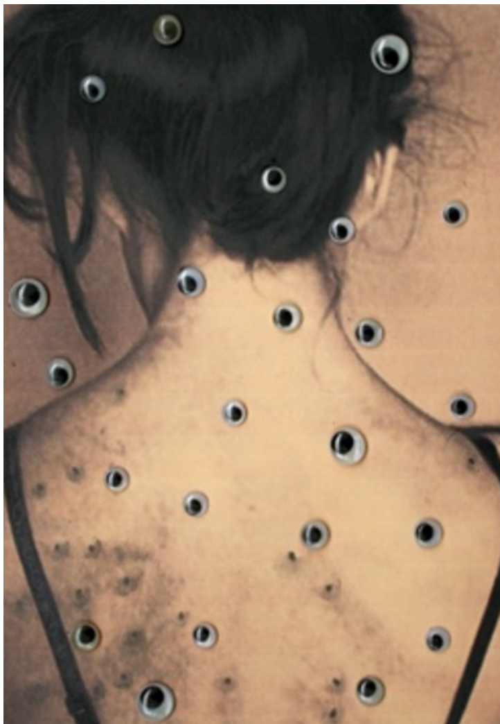
Nota. Obra de la serie Octubre , grafito y ojos de plástico, impresión digital, 30x20 cm, 2023.

Por lo general, las obras parten de fotografías y son involucradas en diferentes procesos creativos. Por ejemplo, el dibujo La larga noche (Figura 8), que da nombre a la serie, incorpora diferentes imágenes, momentos que se unen en una sola pieza, en la que cada fragmento creado por separado empieza a dialogar con el otro. Lo mismo puede decirse de Octubre , y también de toda la exposición Del dibujo como huella . Es un juego de la estética y la dialéctica que busca integrarnos, comprometernos, hacernos parte. Es la forma de decir qué es el dibujo, cómo nos relacionamos con él y qué posiciones adopta el arte ante lo que pasa en el mundo hoy.