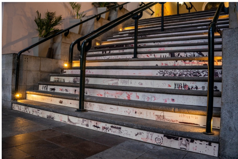
Nota. Obra de sitio específico.

La obra expone la insondable crueldad de la que es capaz el ser humano, pero también su resistencia y su esperanza. Desde el levantamiento popular de octubre de 2019, en Ecuador, hasta el genocidio del pueblo palestino, El retorno de lo nuevo recorre el dolor de una existencia contradictoria, sumida en el derecho soberano y el poder de muerte (Agamben, 2003; Foucault, 2008), en la depredación de la vida y de la naturaleza. Pero también es un homenaje a quienes en el pasado nos han abierto el camino, a un proyecto de cambio, a la permanencia de la utopía.