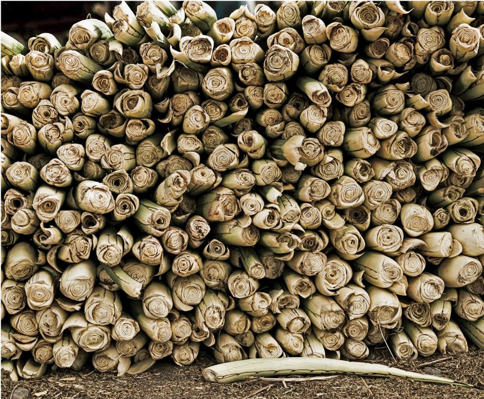
Figura 2 Cogollos de lechuguilla.

Como parte del proceso colectivo propuesto en diálogo y cooperación con los habitantes del ejido Jalpa, dentro del proyecto “Comunidades emergentes de conocimiento y procesos de investigación-creación audiovisual” (CEC-ICreA), 2 asumimos que información y conocimiento se generan y circulan en formatos más allá del texto, por lo que buscamos, a través del trabajo multidisciplinario, diseñar estrategias para desarrollar y gestionar diálogos, en este caso, con una población históricamente desatendida y marginada, creando en conjunto sistemas de información en formatos visuales, sonoros, audiovisuales, cartográficos, entre otros. La idea de que lo que estamos construyendo en colectivo es un mapa-relato surge a partir de los ejercicios reflexivos realizados en la última etapa del proyecto alrededor del proceso de investigación-creación, pues creemos que nombrar colectivamente este territorio dará como resultado una construcción única, una sinfonía de voces y, en consecuencia, podrá surgir algo más poderoso que un mapa gráfico: la imagen ausente, que quizás se manifiesta de otras formas, un mapa de palabras, de recuerdos, imágenes, sensaciones, memorias, no necesariamente un mapa geográfico oficial en términos del reconocimiento de los actores hegemónicos, un mapa-relato que reconozca a las personas y que, al mismo tiempo, sea reconocido por ellas (Moreno y Bravo, 2022).