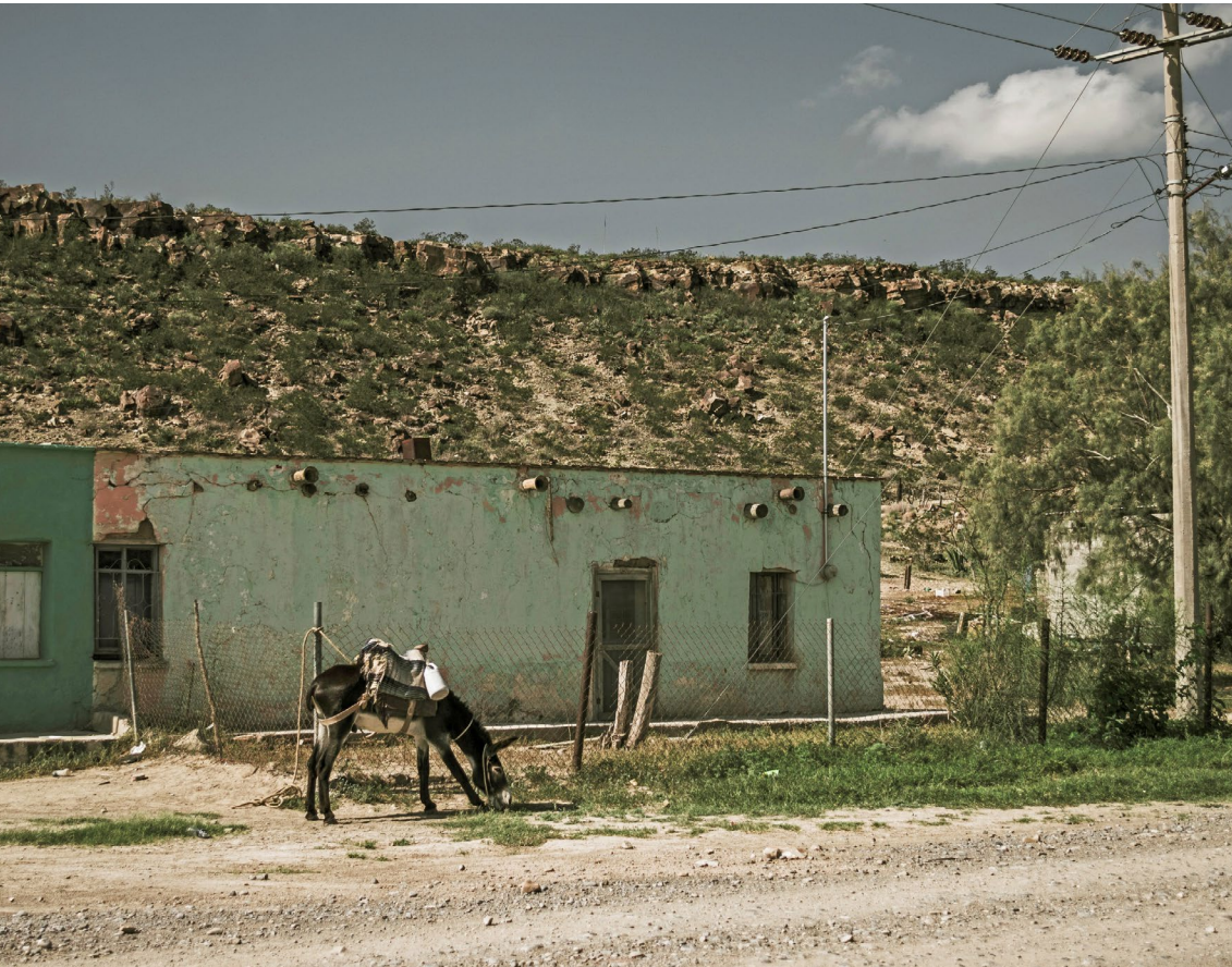
Figura 3 Calle principal del ejido Jalpa.

Nota. En 1992 se modifica el artículo 27 constitucional sobre la propiedad de tierras y aguas, lo que da fin al reparto agrario y abre al libre mercado y propiedad privada la economía mexicana. La desatención del campo en beneficio de la llegada de industrias extranjeras al norte de México ha golpeado a los ejidos, en donde la pobreza y la marginación han hecho disminuir considerablemente su población.