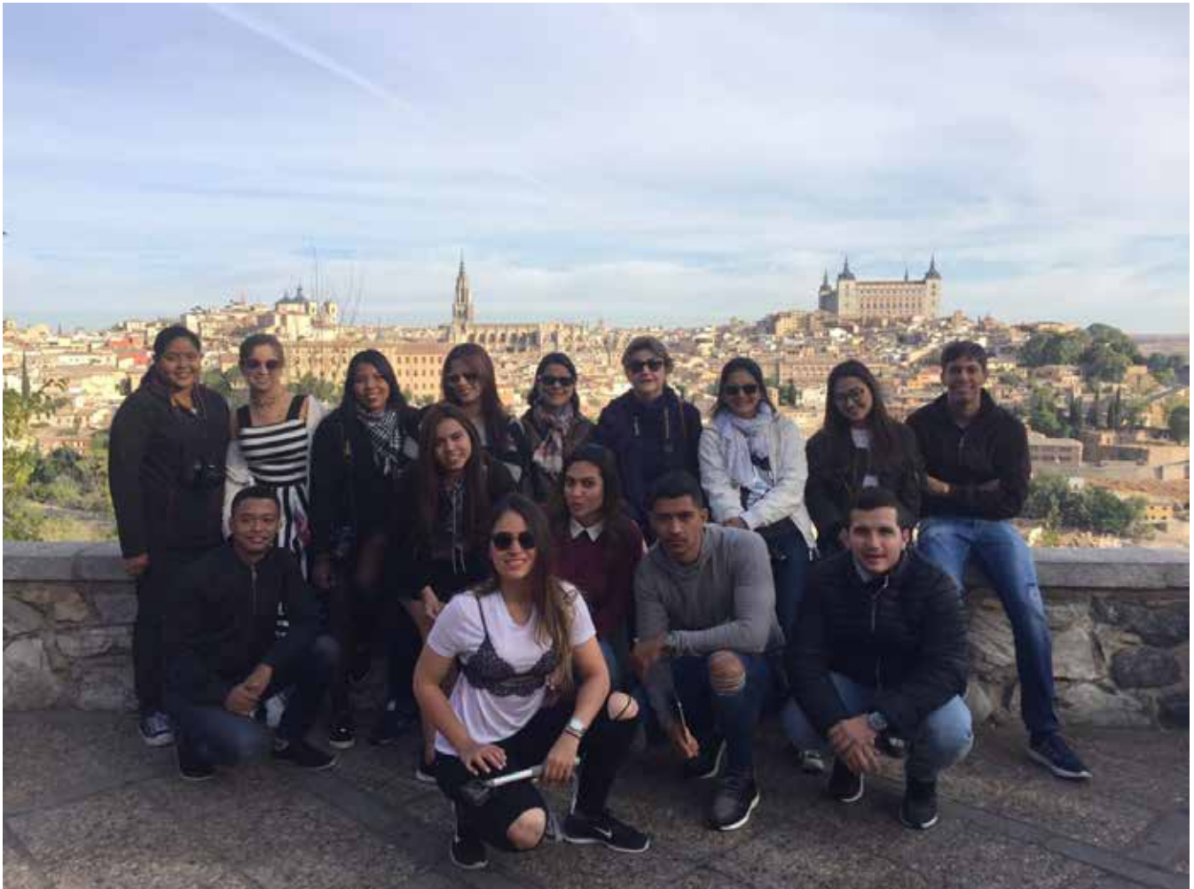
Grupo de estudiantes y profesores participantes en la gira. Madrid.

No cabe duda de que esta actividad aportó mucho a los estudiantes y profesores: conocieron de primera mano cómo es la formación y cuáles son las tendencias y la aplicación de su profesión en otros países; además, ampliaron su bagaje cultural.