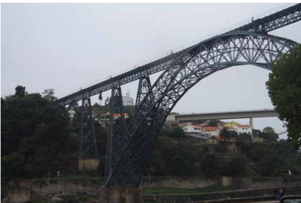
Puente Don Luis I. Oporto.