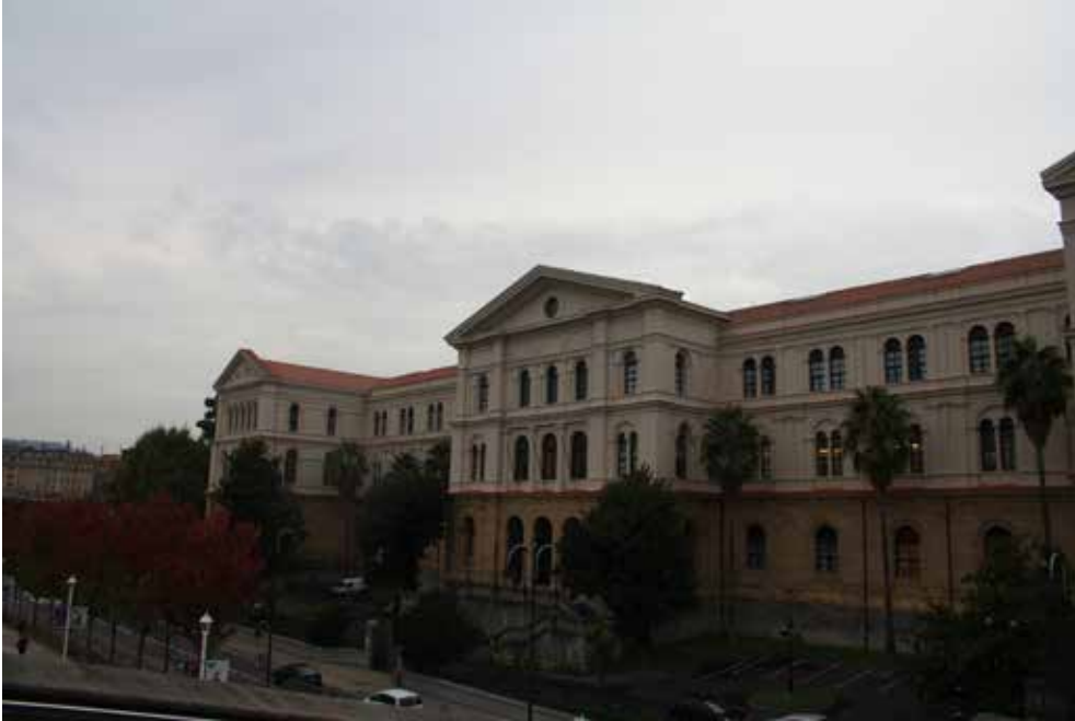
Acceso a las oficinas administrativas de la Universidad de Deusto. Bilbao.