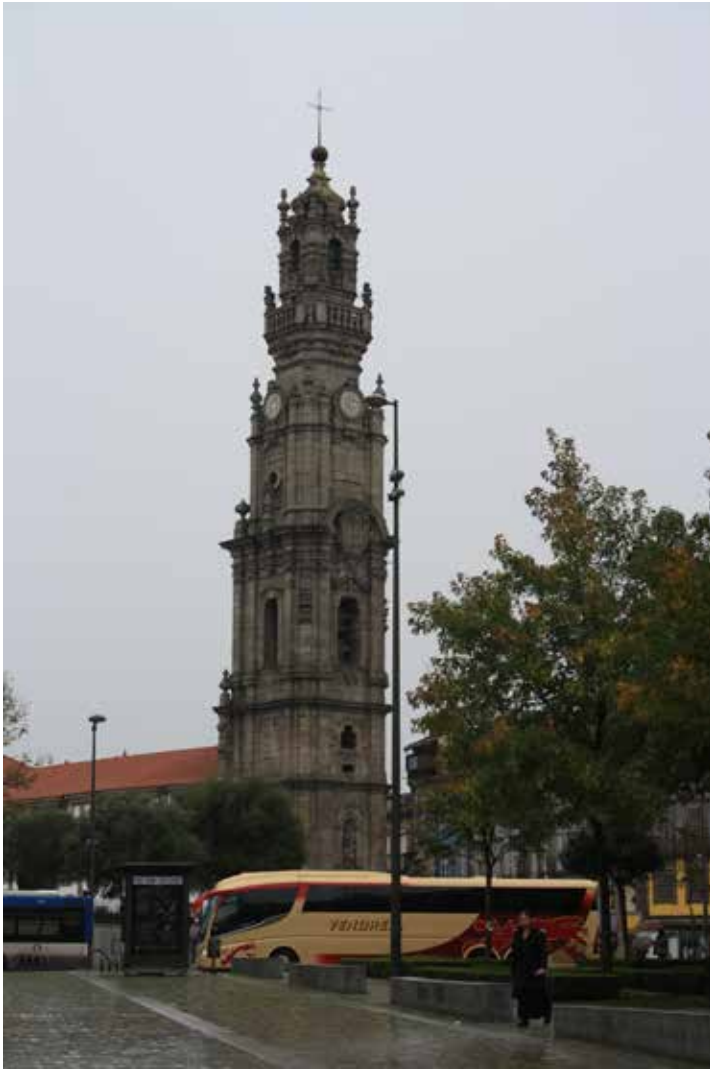
Torre de los Clérigos. Oporto.