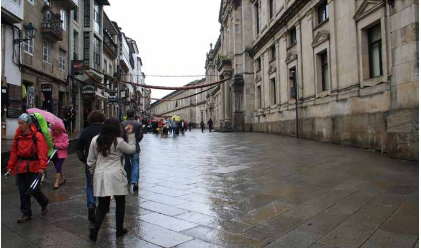
Entrada lateral a la Catedral de Santiago de Compostela.