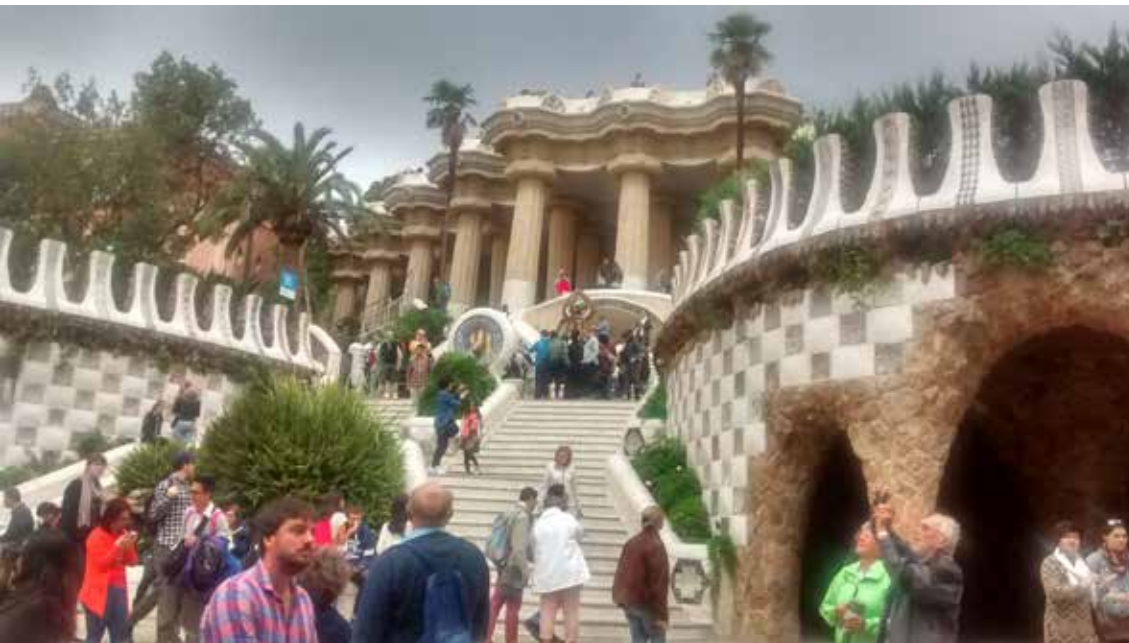
Vista de Park Güell, ideado como urbanización y diseñado por el arquitecto Antoni Gaudí, máximo exponente del modernismo catalán, por encargo del empresario Eusebi Güell. Fue construido entre 1900 y 1914 e inaugurado como parque público en 1926. Barcelona.