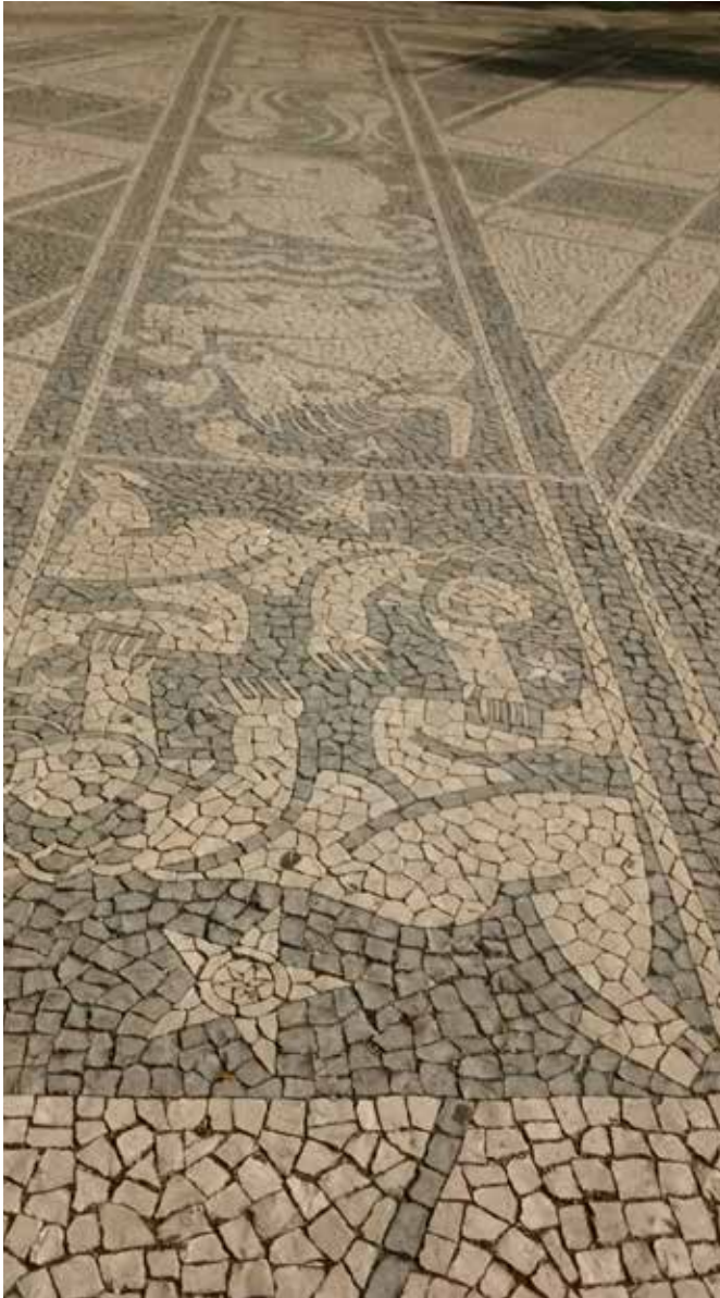
Mosaico aceras sector de Baixa. Lisboa.