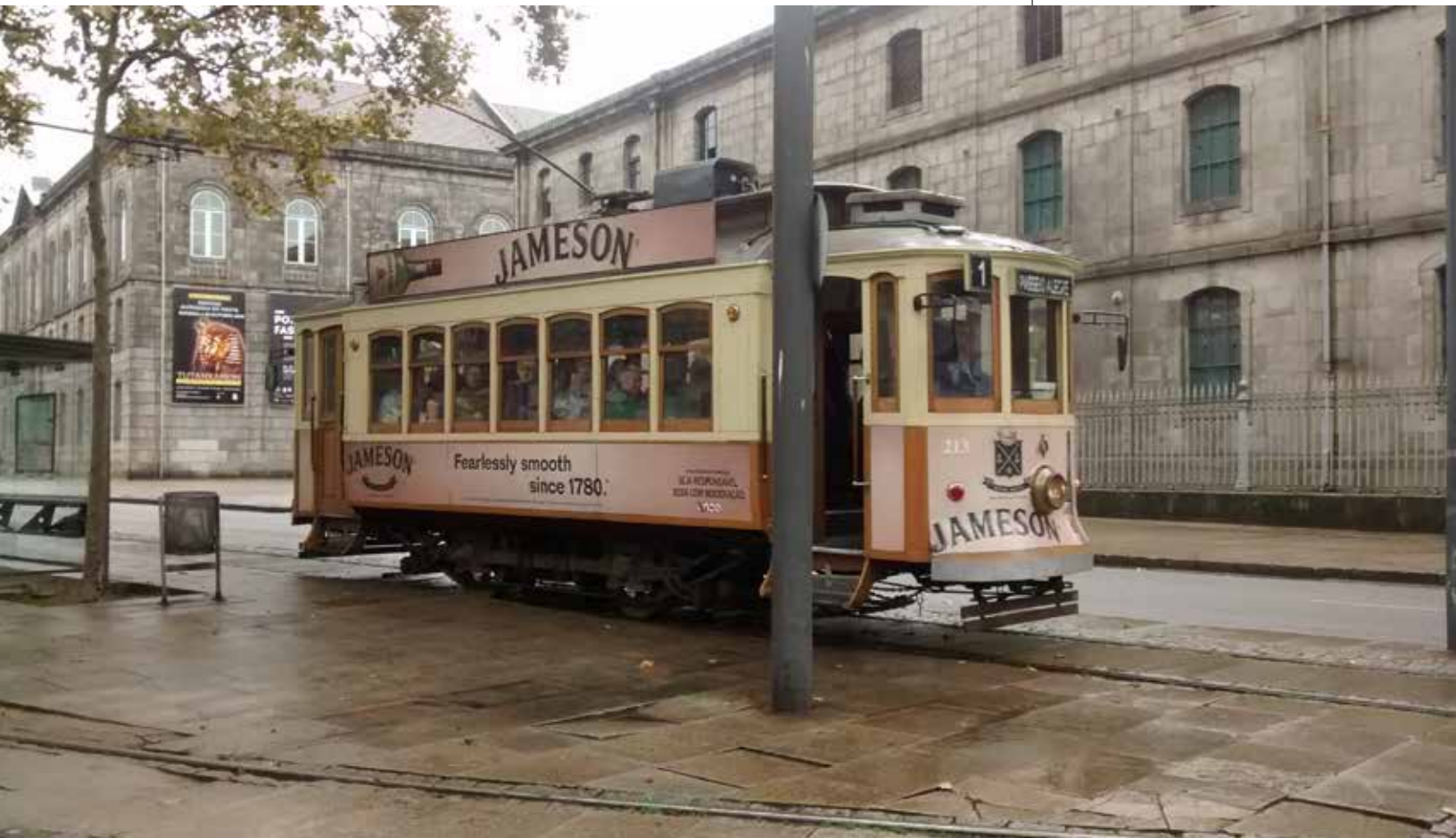
Tranvía en barrio de Oporto.

Comunicación número 45 Julio - diciembre 2021