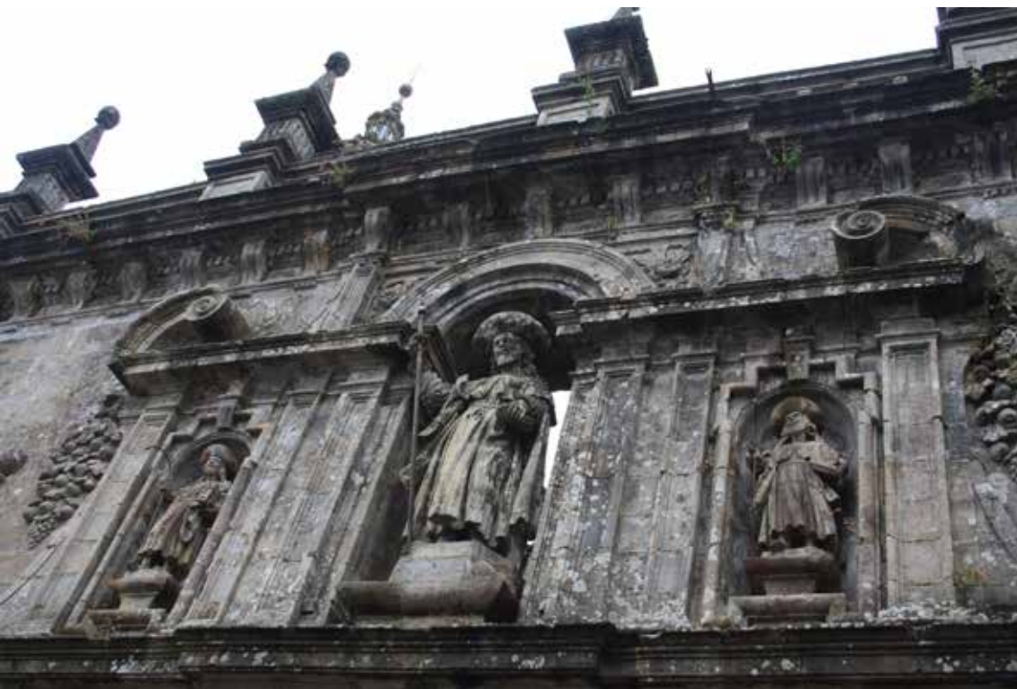
Esculturas de santos en fachada de la Catedral de Santiago.

Uno de los símbolos más famosos de la Catedral de Santiago es el botafumeiro. Esta palabra se traduce literalmente del gallego como “el que echa humo”. Se trata de un gran incensario de latón bañado en plata que tiene un peso de 62 kilos y una altura de 1,60 metros; desprende un peculiar aroma producto de la combustión de carbón junto a incienso. Según la tradición, el uso del incensario en la catedral comenzó en el siglo XI con la idea de perfumar el templo y eliminar el mal olor que dejaban los peregrinos cansados, sudorosos y desaseados, muchos de ellos enfermos.