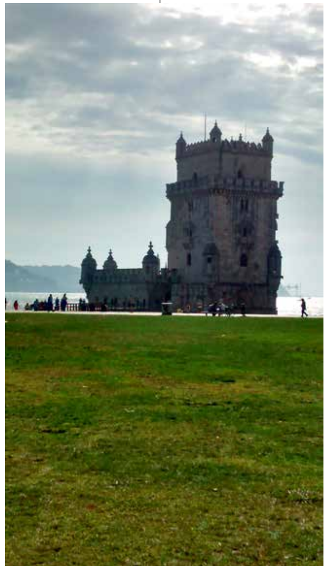
Castillo zona de Belém. Lisboa.