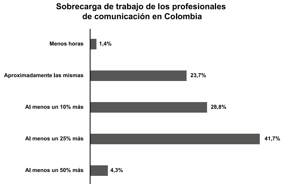
Tabla 3. Sobrecarga de trabajo de los profesionales de comunicación en Colombia en LCM 2014-2015

Fuente: Equipo de investigación LCM 2014-2015