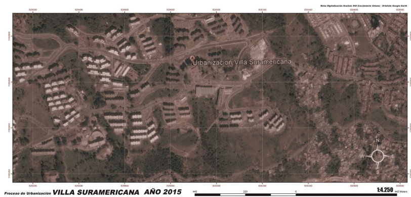
Figura 4. Villa Suramericana y alrededores (2015).